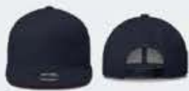
AZUL MARINO SAL: 82794-02115 UNITALLA