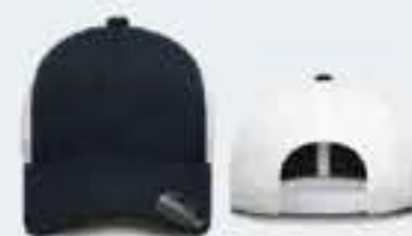
AZUL MARINO/BLANCO UN TALLA