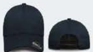
AZUL MARINO DIA: 65201-65201 UNITALLA