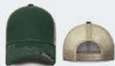
VERDE BOTELLA/KAKY 040. 24901-24902 / UNITALLA