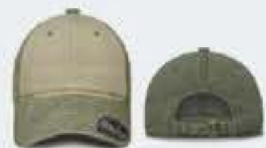
SKU: 22857-02001 UNITALLA