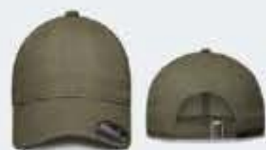
VERDE OLIVO SKU: 19842-0707 UNITALLA