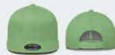
VERDE MENTA SKU: 8274-00000 UNITALLA