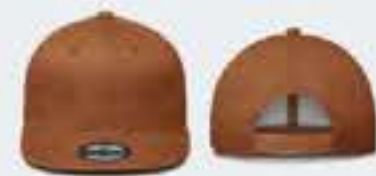
NARANJA LADRILLO SKU: 8274-00000 UNITALLA