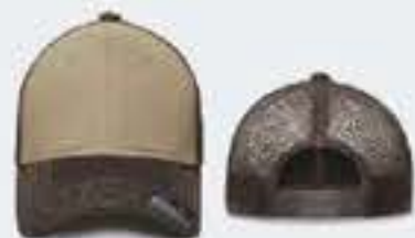
KAKY/CAFÉ/CAFÉ 040. 24901-24902 / UNITALLA