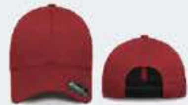
ROJO DIA: 65201-65201 UNITALLA