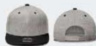
GRIS CL JASPE/NEGRO SKU: 10794-01003 UNITALLA