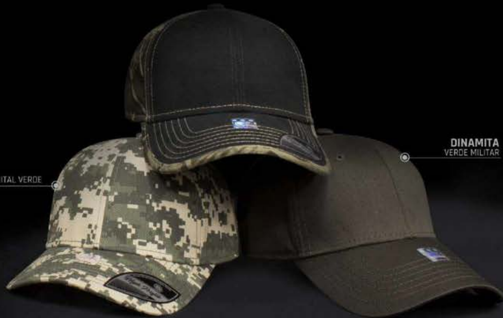
DINAMITA VERDE MILITAR