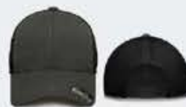
GRIS OSCURO/NEGRO UN TALLA