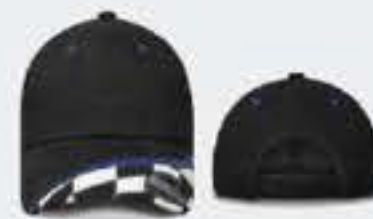
VIVOS EN AZUL REY