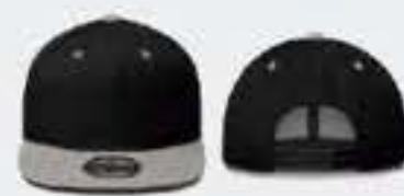
NEGRO/GRIS CLARO SKU: 10794-01401 UNITALLA