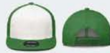
BLANCO/V.BANDERA/V.BANDERA SKU: 42194-00006 UNITALLA