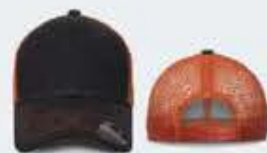
NEGRO/NARANJA SKU: 10492-01011 UNITALLA