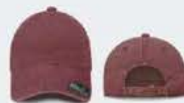
VINO 842 4004-8004 UNITALLA