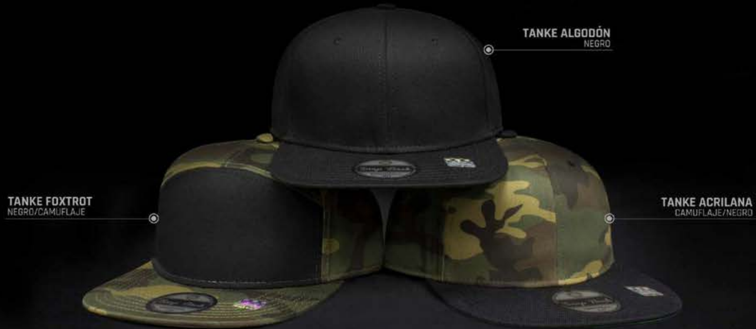
TANKE ALGODÓN NEGRO