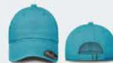
AZUL TURQUESA 842 4004-8004 UNITALLA