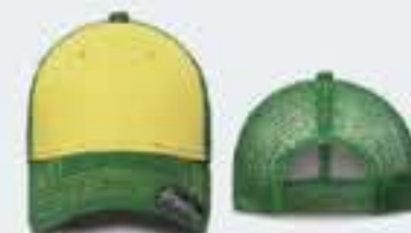
AMARILLO CL/BANDERA/BANDERA SKU: 22761-180045 UNITALLA