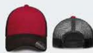
ROJO/NEGRO/NEGRO SKU: 22761-180045 UNITALLA