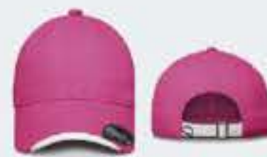
ROSA FUCSIA/BLANCO SOL. 40-50-50CM UNITALLA