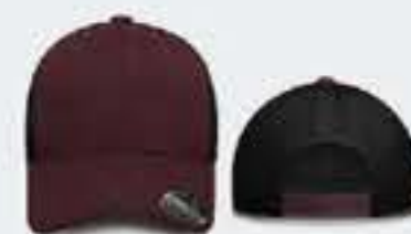
VINO/NEGRO UN TALLA