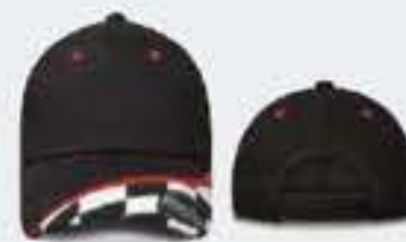
VIVOS EN ROJO