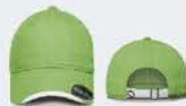
VERDE LIMÓN/BLANCO UNITALLA