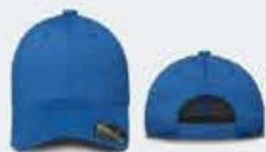
AZUL REY JASPE SKU: 20192-02008 UNITALLA