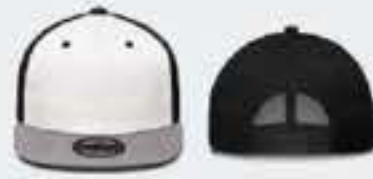
BLANCO/GRIS CL/NEGRO SKU: 42194-00001 UNITALLA