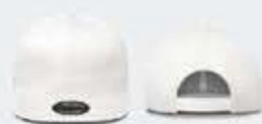
BLANCO SKU: 8274-00000 UNITALLA