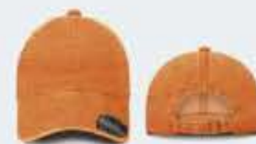
NARANJA CLARO 842 4004-8004 UNITALLA