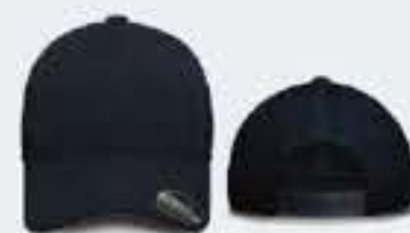
A.MARINO/A. MARINO UN TALLA