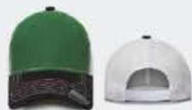
V.BANDERA/NEGRO/BLANCO 040. 24901-24902 / UNITALLA