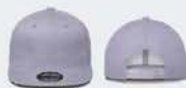
LAVANDA SKU: 8274-00000 UNITALLA