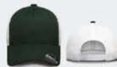
V.BOTELLA/BLANCO UN TALLA