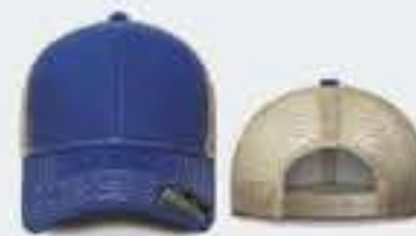
AZUL REY/KAKY SKU: 10492-01030 UNITALLA