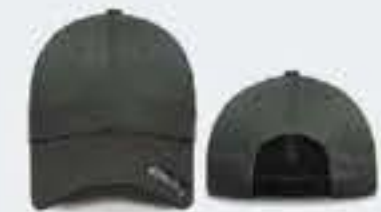
GRIS OSCURO DIA: 65201-65201 UNITALLA