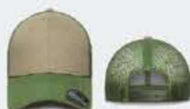
KAKY/V.IRLANDÉS/V.IRLANDÉS 040. 24901-24902 / UNITALLA