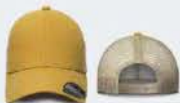
AMARILLO MOSTAZA/KAKY SKU: 22761-180045 UNITALLA