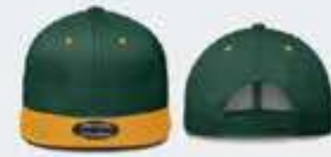
SKU: 42194-00022 UNITALLA