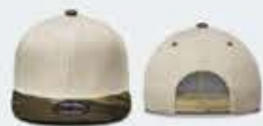
ARENA JASPE/CAMUFLAJE SAL: 82794-02104 UNITALLA