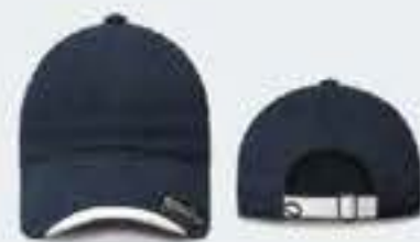
AZUL MARINO/BLANCO UNITALLA