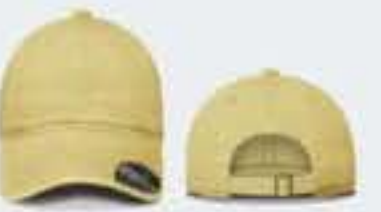
AMARILLO CLARO SKU: 22857-02001 UNITALLA