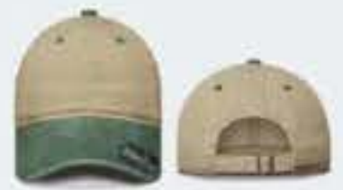
SKU: 22857-02001 UNITALLA