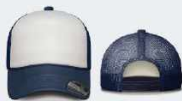
BLANCO/AZUL MARINO SKU: E280H-00222 UNITALLA