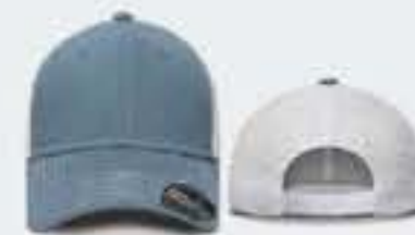
AZUL ACERO/BLANCO SKU: 10492-01033 UNITALLA