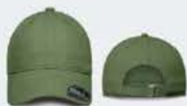
VERDE MUSGO SKU: 19842-0692 UNITALLA