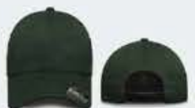
VERDE BOTELLA DIA: 65201-65201 UNITALLA