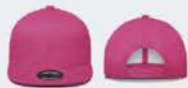
ROSA FUCSIA SKU: 8274-00000 UNITALLA