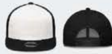
BLANCO/NEGRO/NEGRO SKU: 42194-00002 UNITALLA