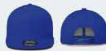
AZUL REY SAL: 82794-02117 UNITALLA