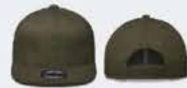
VERDE MILITAR SKU: 8274-00000 UNITALLA