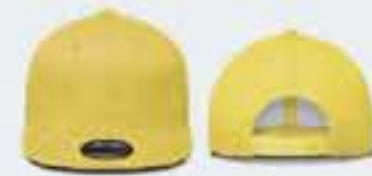
AMARILLO CLARO SKU: 8274-00000 UNITALLA