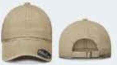
KAKY SKU: 22857-02001 UNITALLA