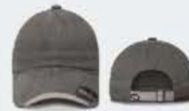
GRIS OBS/GRIS CLARO SOL. 40-50-50CM UNITALLA