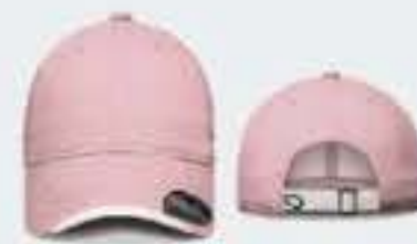
ROSA PASTEL/BLANCO SOL. 40-50-50CM UNITALLA