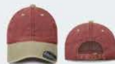
ROJO/KAKY 842 4004-8004 UNITALLA