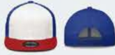
BLANCO/ROJO/A.REY SKU: 42194-00011 UNITALLA