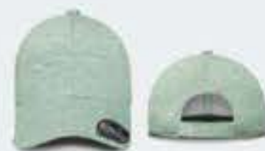
VERDE MENTA JASPE SKU: 20192-02006 UNITALLA