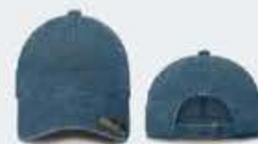
AZUL MARINO 842 4004-8004 UNITALLA