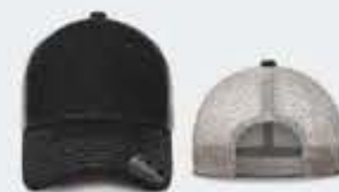
NEGRO/GRIS CLARO SKU: 10492-01014 UNITALLA