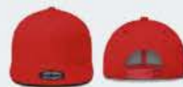
ROJO SAL: 82794-02113 UNITALLA