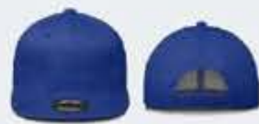
AZUL REY SKU: 8274-00000 UNITALLA