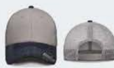
GRIS CL/A.MARINO/GRIS CL SKU: 10790-48004 UNITALLA