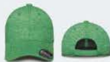
VERDE BANDERA JASPE SKU: 20192-02007 UNITALLA