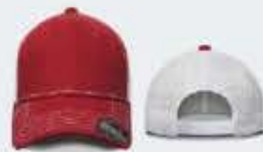
ROJO/BLANCO SKU: 22761-180045 UNITALLA