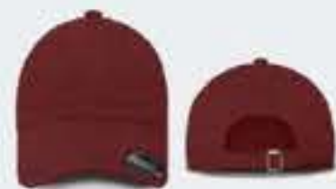
ROJO CEREZA SKU: 19842-0691 UNITALLA