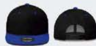
NEGRO/AZUL REY SKU: 10794-02941 UNITALLA