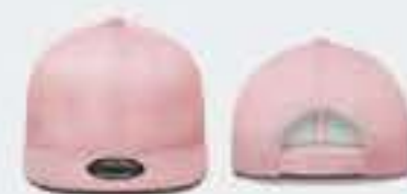
ROSA PASTEL SKU: 8274-00000 UNITALLA