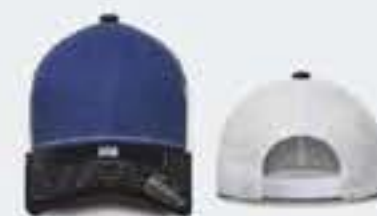
AZUL REY/NEGRO/BLANCO SKU: 10492-01027 UNITALLA