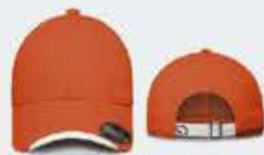
N. MANDARINA/BLANCO SOL. 40-50-50CM UNITALLA