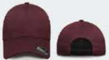
VINO DIA: 65201-65201 UNITALLA