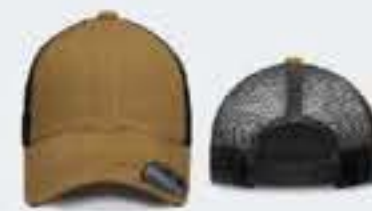
AMARILLO TRIGO/NEGRO SKU: 22761-180045 UNITALLA