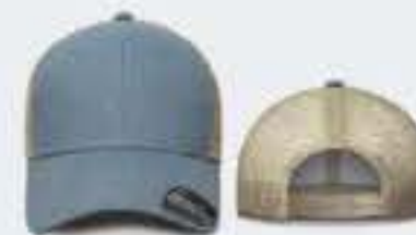
AZUL ACERO/KAKY SKU: 10492-01032 UNITALLA