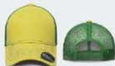
AMARILLO CL/V.BANDERA SKU: 22761-180045 UNITALLA