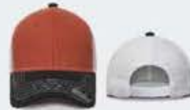
N.MANDARINA/NEGRO/BLANCO SKU: 22761-180045 UNITALLA