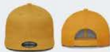
AMARILLO MANGO SKU: 8274-00000 UNITALLA