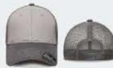
GRIS CL/GRIS OBSC/GRIS OBSC SKU: 10790-48006 UNITALLA