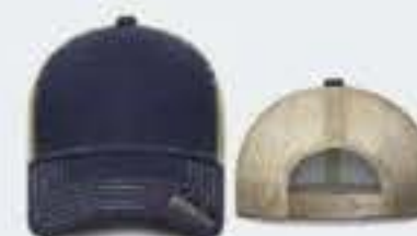
AZUL MARINO/KAKY SKU: 10492-01024 UNITALLA