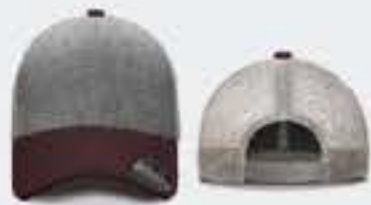
GRIS CL.JASPE/MARRÓN/GRIS CL SKU: 10790-48009 UNITALLA