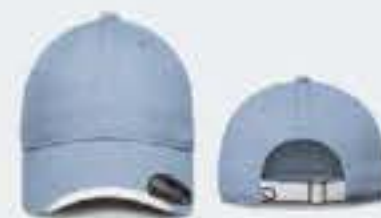
AZUL CIELO/BLANCO UNITALLA