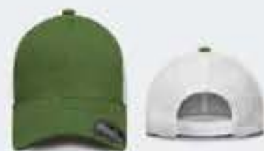
VERDE IRLANDÉS/BLANCO 040. 25701-25702 / UNITALLA