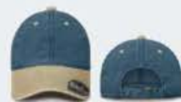
842 4004-8004 UNITALLA