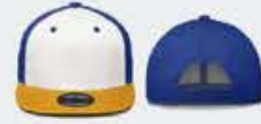
BLANCO/A.MANGO/A.REY SKU: 42194-00013 UNITALLA