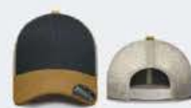
A.ÍNDIGO/A.TRIGO/ARENA SKU: 10492-01020 UNITALLA