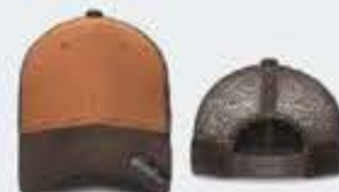
N.LADRILLO/CAFÉ/CAFÉ SKU: 22761-180045 UNITALLA