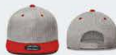
GRIS CL JASPE/ROJO SKU: 10794-01003 UNITALLA