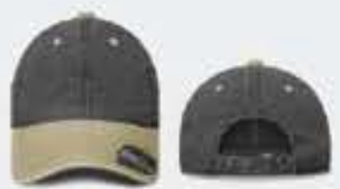
NEGRO/KAKY SKU: 22857-02001 UNITALLA