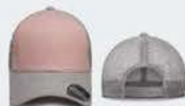
ROSA PASTEL/GRIS CL/GRIS CL SKU: 22761-180045 UNITALLA