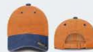
NARANJA CLARO/MARINO 842 4004-8004 UNITALLA