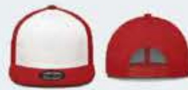
BLANCO/ROJO/ROJO SKU: 42194-00004 UNITALLA