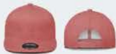
ROSA CORAL SKU: 8274-00000 UNITALLA