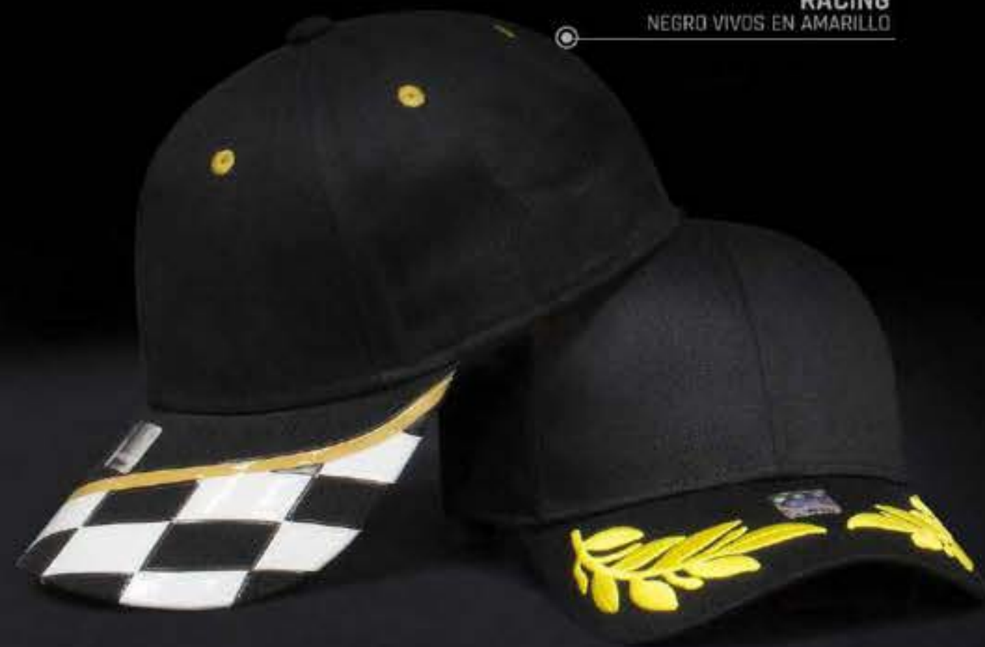
RACING NEGRO VIVOS EN AMARILLO