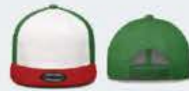
BLANCO/ROJO/V.BANDERA SKU: 42194-00005 UNITALLA