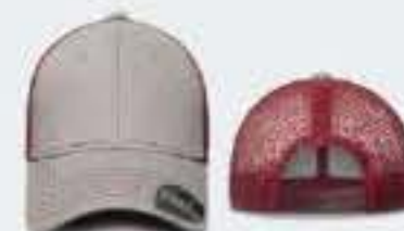
GRIS CLARO/VINO SKU: 22761-180045 UNITALLA