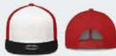
BLANCO/NEGRO/ROJO SKU: 42194-00003 UNITALLA