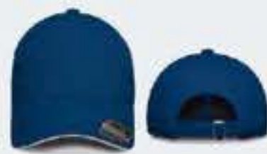
AZUL REY/SW BLANCO