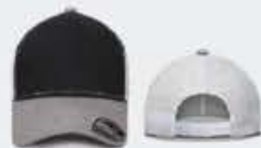
NEGRO/GRIS CL/BLANCO SKU: 10492-01018 UNITALLA