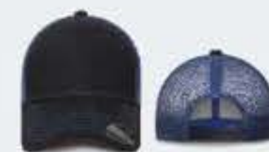
NEGRO/AZUL REY SKU: 10492-01017 UNITALLA