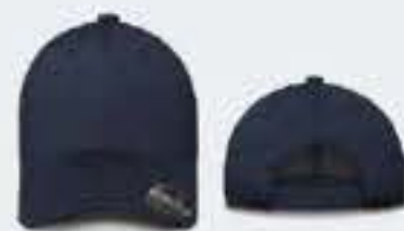
AZUL MARINO JASPE SKU: 20192-02009 UNITALLA