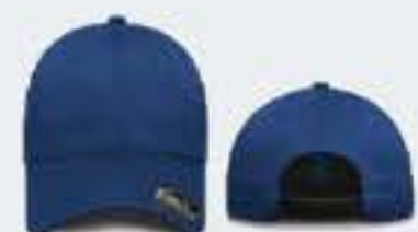
AZUL REY DIA: 65201-65201 UNITALLA