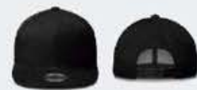
NEGRO SKU: 10794-00001 UNITALLA