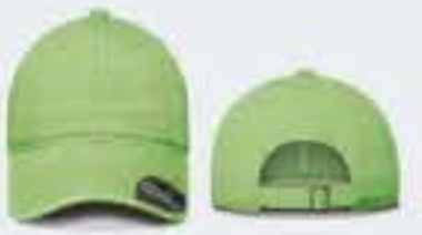
VERDE LIMÓN SKU: 22857-02001 UNITALLA