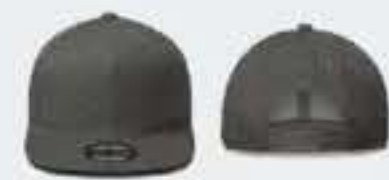
GRIS OBSCURO SKU: 10794-00002 UNITALLA