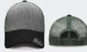
GRIS CL.JASPE/NEGRO/BOTELLA SKU: 10790-48007 UNITALLA