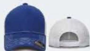
AZUL REY/BLANCO SKU: 10492-01026 UNITALLA