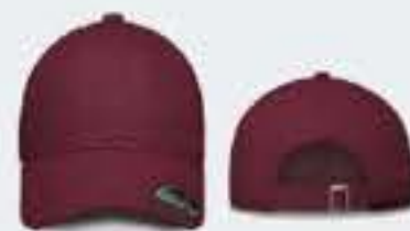
VINO SKU: 19842-0692 UNITALLA