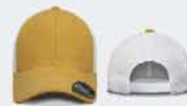
A.MOSTAZA/BLANCO SKU: 22761-180045 UNITALLA