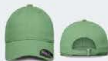
VERDE MENTA SKU: 19842-0693 UNITALLA