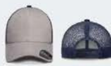
GRIS CLARO/AZUL MARINO SKU: 10790-48003 UNITALLA