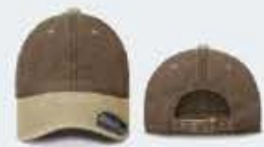
CAFÉ/KAKY SKU: 22857-02001 UNITALLA