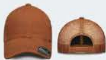
N.LADRILLO/COST. NEGRO SKU: 22761-180045 UNITALLA