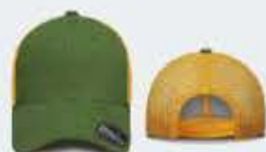
VERDE IRLANDÉS/MANGO 040. 24901-24902 / UNITALLA