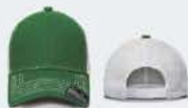
VERDE BANDERA/BLANCO 040. 24901-24902 / UNITALLA