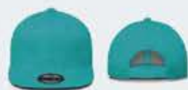
AZUL CIAN SKU: 8274-00000 UNITALLA