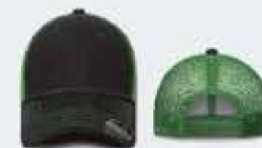
NEGRO/VERDE BANDERA SKU: 10492-01016 UNITALLA