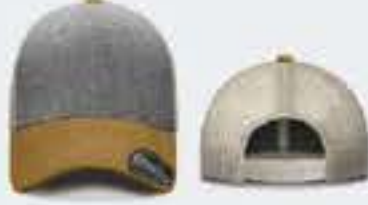
GRIS CL.JASPE/TRIGO/ARENA SKU: 10790-48011 UNITALLA