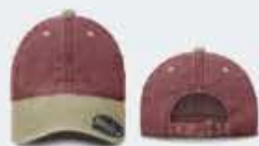
VINO/KAKY 842 4004-8004 UNITALLA