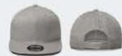
GRIS CLARO SKU: 10794-00003 UNITALLA