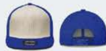
ARENA JASPE/A.REY/A.REY SAL: 82794-02105 UNITALLA