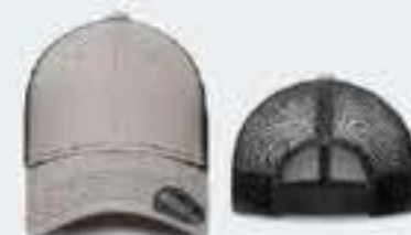
GRIS CLARO/NEGRO SKU: 22761-180045 UNITALLA