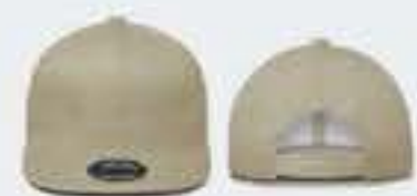
ARENA SKU: 8274-00000 UNITALLA