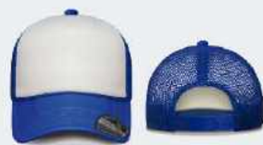
BLANCO/AZUL REY SKU: E280H-00221 UNITALLA