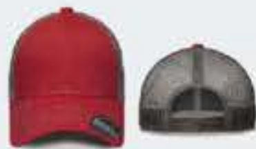
ROJO/GRIS OSCURO SKU: 22761-180046 UNITALLA