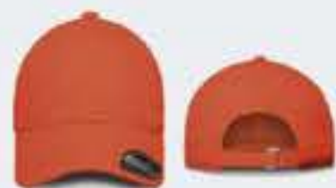
NARANJA MANDARINA SKU: 19842-0699 UNITALLA