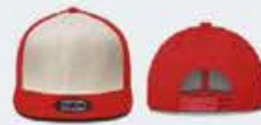
ARENA JASPE/ROJO/ROJO SAL: 82794-02106 UNITALLA