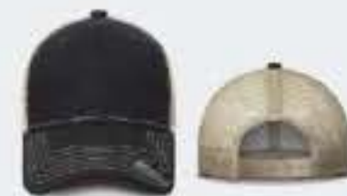
NEGRO/KAKY SKU: 10492-01013 UNITALLA