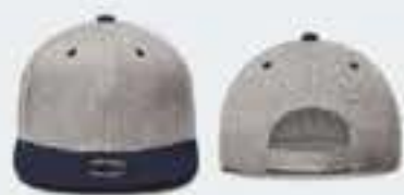
GRIS CL JASPE/A.MARINO SAL: 82794-02102 UNITALLA