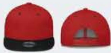
ROJO/NEGRO SKU: 42194-00016 UNITALLA