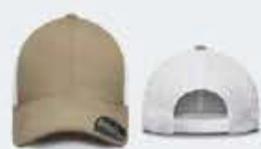
KAKY/BLANCO 040. 24901-24902 / UNITALLA