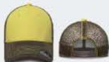
AMARILLO CL/CAFÉ/CAFÉ SKU: 22761-180045 UNITALLA