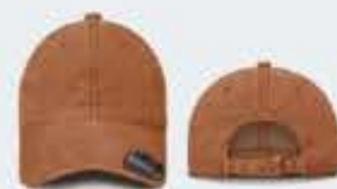
NARANJA LADRILLO 842 4004-8004 UNITALLA