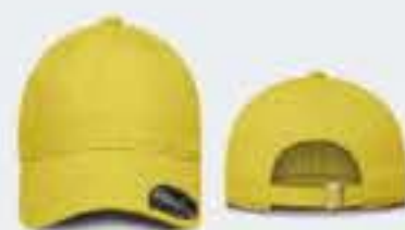
AMARILLO CLARO SKU: 19842-0695 UNITALLA