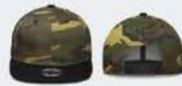
CAMUFLAJE/NEGRO SKU: 42194-00021 UNITALLA