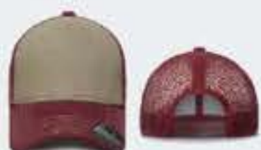
KAKY/VINO/VINO 040. 24901-24902 / UNITALLA