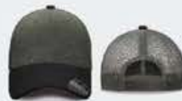
GRIS O.JASPE/NEGRO/GRIS O. SKU: 10790-48012 UNITALLA