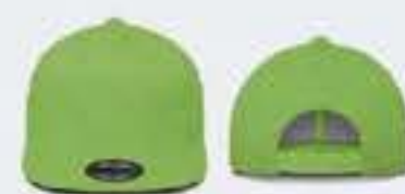
VERDE LIMÓN SKU: 8274-00000 UNITALLA