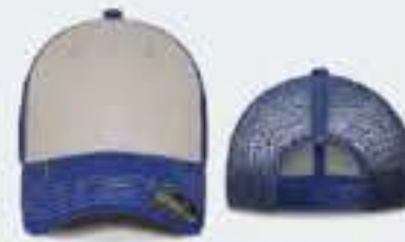
GRIS CLARO/AZUL REY SKU: 10790-48005 UNITALLA