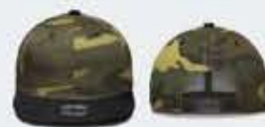
CAMUFLAJE/NEGRO SAL: 82794-02110 UNITALLA