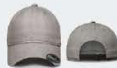
GRIS CLARO/NEGRO SOL. 40-50-50CM UNITALLA