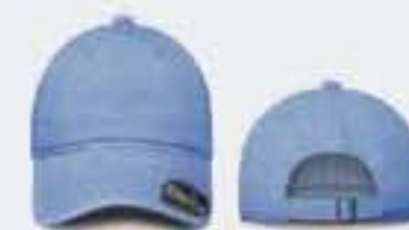
AZUL CIELO 842 4004-8004 UNITALLA