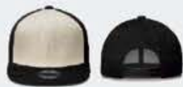
ARENA JASPE/NEGRO/NEGRO SAL: 82794-02109 UNITALLA