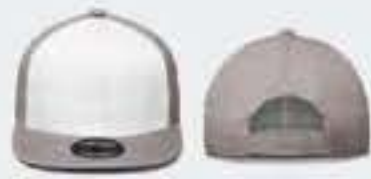
BLANCO/GRIS CL/GRIS CL SKU: 42194-00000 UNITALLA