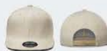
ARENA JASPE SAL: 82794-02101 UNITALLA