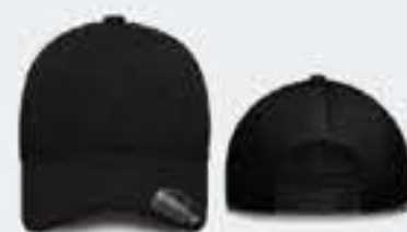
NEGRO/NEGRO UN TALLA