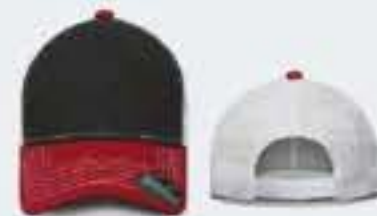
NEGRO/ROJO/BLANCO SKU: 10492-01019 UNITALLA