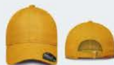
AMARILLO MANGO SKU: 19842-0697 UNITALLA