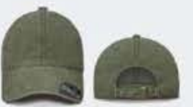
VERDE OLIVO SKU: 22857-02001 UNITALLA