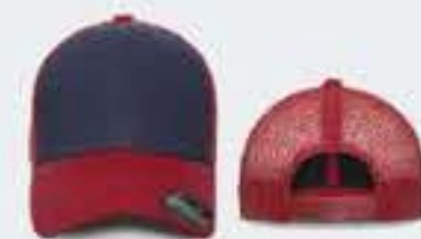
A.MARINO/ROJO/ROJO SKU: 10492-01021 UNITALLA