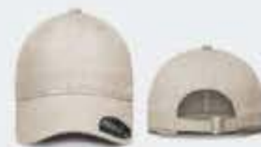
ARENA SKU: 19842-0695 UNITALLA