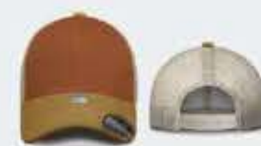
N.LADRILLO/A.TRIGO/ARENA SKU: 22761-180045 UNITALLA