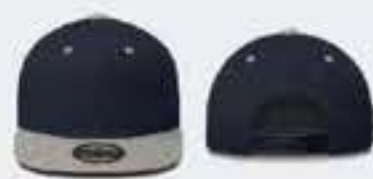
AZUL MARINO/GRIS CLARO SAL: 82794-02116 UNITALLA