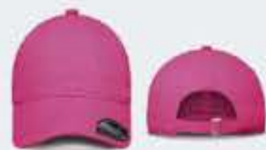
ROSA FUCSIA SKU: 19842-0696 UNITALLA