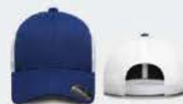
AZUL REY/BLANCO UN TALLA