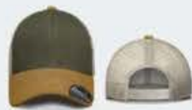
V.MUSGO/A.TRIGO/ARENA 040. 25701-25702 / UNITALLA