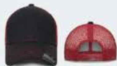
NEGRO/ROJO SKU: 10492-01010 UNITALLA