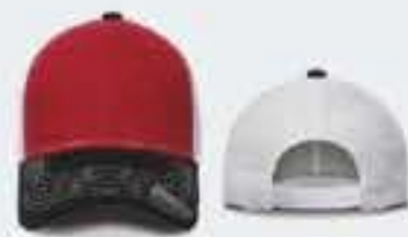
ROJO/NEGRO/BLANCO SKU: 22761-180045 UNITALLA