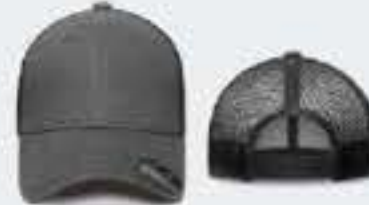
GRIS O.BSCURO/NEGRO SKU: 10790-48013 UNITALLA