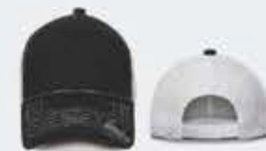
NEGRO/BLANCO SKU: 10492-01015 UNITALLA