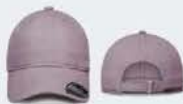
LILA SKU: 19842-0699 UNITALLA