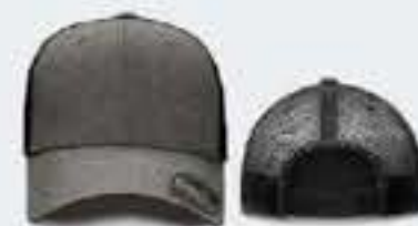
GRIS OBSC. JASPE/NEGRO S/M - 55CM - 64CM UNITALLA