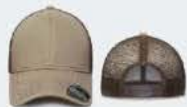
KAKY/CAFÉ 040. 24901-24902 / UNITALLA