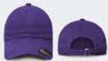
MORADO SKU: 19842-0701 UNITALLA