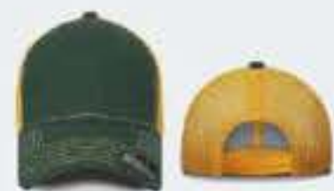
VERDE BOTELLA/MANGO 040. 24901-24902 / UNITALLA