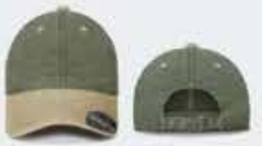
VERDE OLIVO/KAKY SKU: 22857-02001 UNITALLA