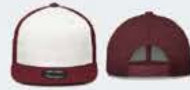
BLANCO/VINO/VINO SKU: 42194-00014 UNITALLA