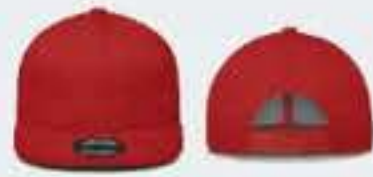
ROJO SKU: 42194-00017 UNITALLA