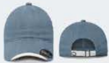
AZUL ACERO/BLANCO UNITALLA