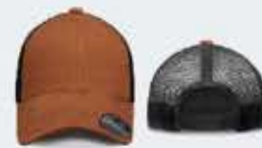
N.LADRILLO/NEGRO SKU: 22761-180045 UNITALLA