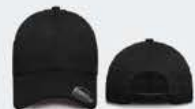
NEGRO DIA: 65201-65201 UNITALLA