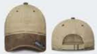
KAKY/CAFÉ SKU: 22857-02001 UNITALLA