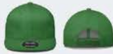
VERDE BANDERA SKU: 42194-00019 UNITALLA