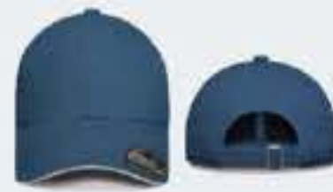
AZUL ACERO/SW BLANCO