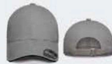
GRIS CLARO/SW NEGRO