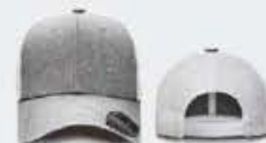
GRIS CL JASPE/BLANCO S/M - 55CM - 64CM UNITALLA