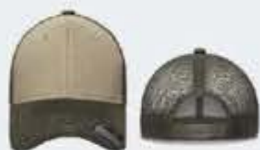
KAKY/VERDE MILITAR 040. 24901-24902 / UNITALLA