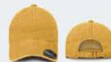
AMARILLO MOSTAZA 842 4004-8004 UNITALLA