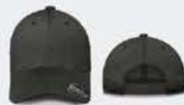
NEGRO JASPE SKU: 20192-02002 UNITALLA