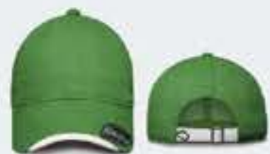
VERDE BANDERA/BLANCO UNITALLA