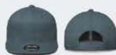
AZUL ACERO SKU: 8274-00000 UNITALLA