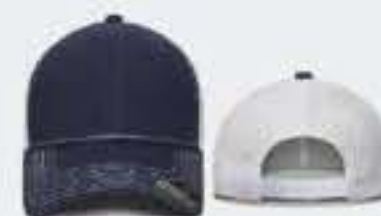
AZUL MARINO/BLANCO SKU: 10492-01025 UNITALLA