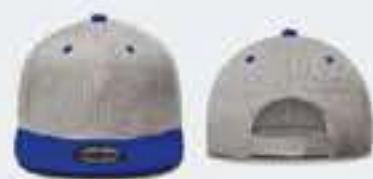
GRIS CL JASPE/AZUL REY SAL: 82794-02103 UNITALLA