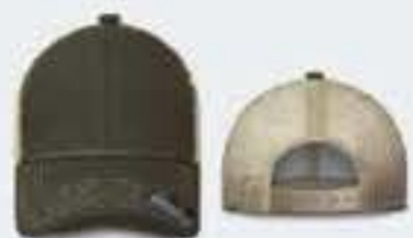
VERDE MILITAR/KAKY 040. 24901-24902 / UNITALLA