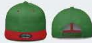
VERDE BANDERA/ROJO SKU: 42194-00018 UNITALLA