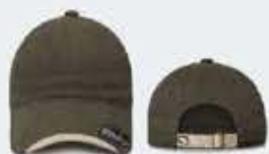
VERDE MILITAR/KAKY UNITALLA