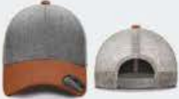
GRIS CL.JASPE/LADRILLO/GRIS CL SKU: 10790-48010 UNITALLA