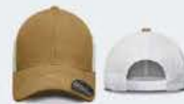
AMARILLO TRIGO/BLANCO SKU: 22761-180045 UNITALLA