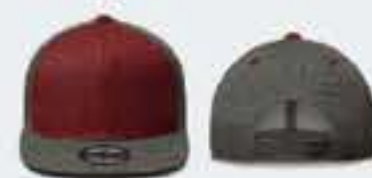
VINO/GRIS O.JASPE/GRIS O.JASPE SAL: 82794-02112 UNITALLA