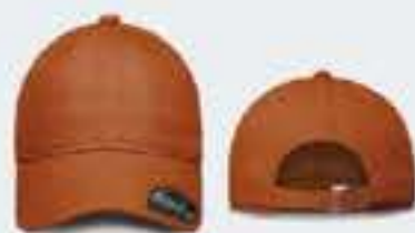
NARANJA LADRILLO SKU: 19842-0700 UNITALLA