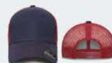
A.MARINO/A.MARINO/ROJO SKU: 10492-01022 UNITALLA