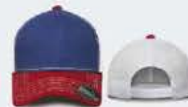
AZUL REY/ROJO/BLANCO SKU: 10492-01028 UNITALLA