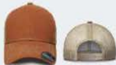
N.LADRILLO/KAKY SKU: 22761-180045 UNITALLA