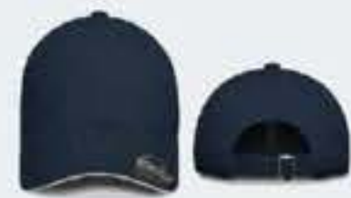
AZUL MARINO/SW BLANCO