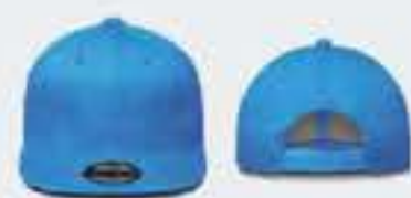
AZUL TURQUESA SKU: 8274-00000 UNITALLA