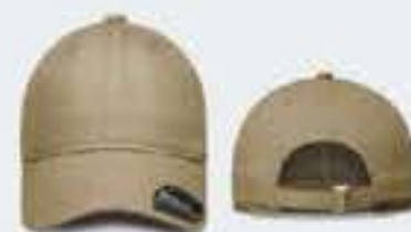
KAKY SKU: 19842-0694 UNITALLA