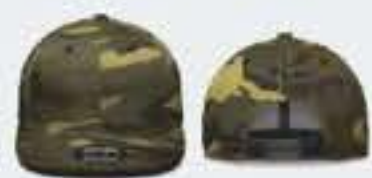
CAMUFLAJE VERDE MILITAR SAL: 82794-02111 UNITALLA