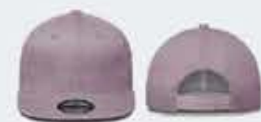
LILA SKU: 8274-00000 UNITALLA