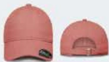
ROSA CORAL SKU: 19842-0697 UNITALLA