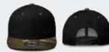
NEGRO/CAMUFLAJE SKU: 10794-01941 UNITALLA