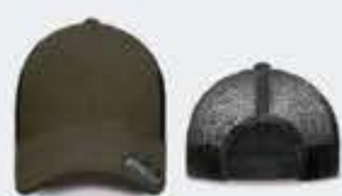
VERDE MILITAR/NEGRO 040. 24901-24902 / UNITALLA