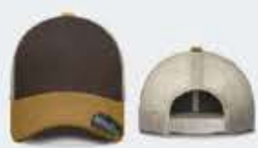
CAFÉ/A.TRIGO/ARENA 040. 24901-24902 / UNITALLA