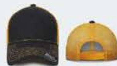
NEGRO/A.MANGO SKU: 10492-01012 UNITALLA