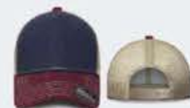
A.MARINO/VINO/KAKY SKU: 10492-01023 UNITALLA