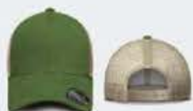
VERDE IRLANDÉS/KAKY 040. 24901-24902 / UNITALLA