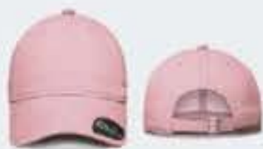
ROSA PASTEL SKU: 19842-0698 UNITALLA