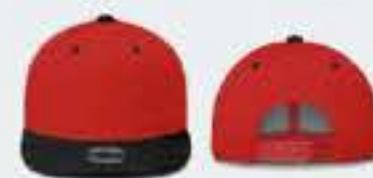
ROJO/NEGRO SAL: 82794-02114 UNITALLA