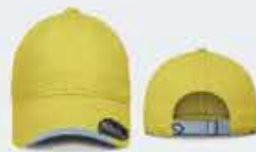
AMARILLO PASTEL/A.CIELO SOL. 40-50-50CM UNITALLA