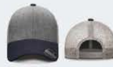
GRIS CL.JASPE/MARINO/GRIS CL SKU: 10790-48008 UNITALLA