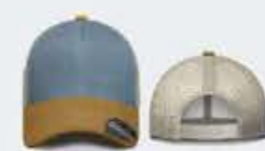
A.ACERO/A.TRIGO/ARENA SKU: 10492-01031 UNITALLA