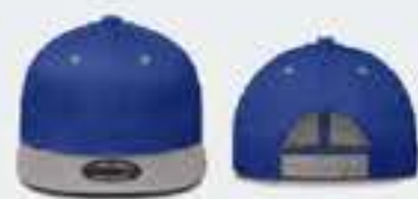
AZUL REY/GRIS CLARO SKU: 8274-00000 UNITALLA