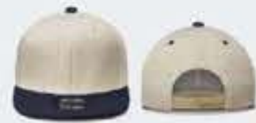
ARENA JASPE/MARINO SAL: 82794-02107 UNITALLA