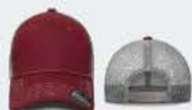
VINO/GRIS 040. 24901-24902 / UNITALLA