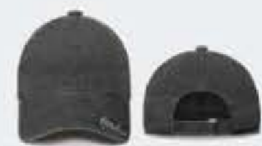
NEGRO SKU: 22857-02001 UNITALLA