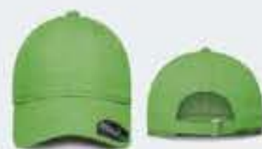
VERDE LIMÓN SKU: 19842-0694 UNITALLA