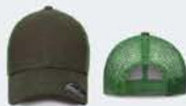
VERDE MILITAR/V.BANDERA 040. 24901-24902 / UNITALLA