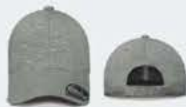
GRIS TORMENTA SKU: 20192-02003 UNITALLA