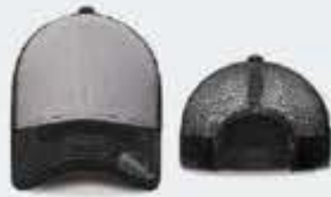
GRIS CLARO/NEGRO/NEGRO SKU: 10790-48001 UNITALLA