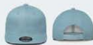
AZUL CIELO SKU: 8274-00000 UNITALLA