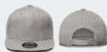
GRIS CLARO JASPE SKU: 10794-01003 UNITALLA