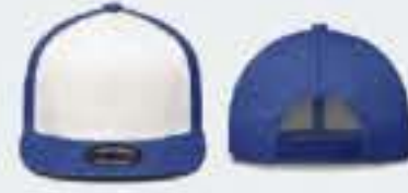
BLANCO/A.REY/A.REY SKU: 42194-00012 UNITALLA