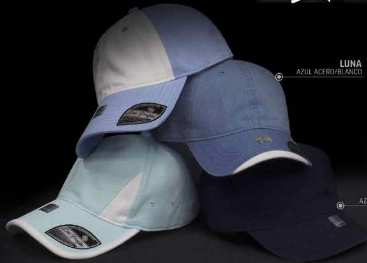
LUNA AZUL ACERO/BLANCO