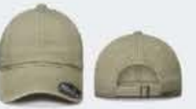
ARENA SKU: 22857-02001 UNITALLA