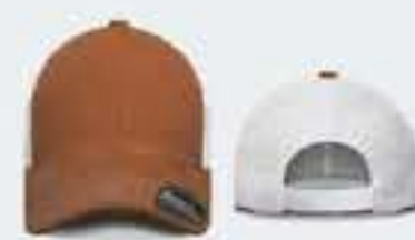
N.LADRILLO/BLANCO SKU: 22761-180045 UNITALLA