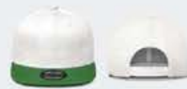
BLANCO/VERDE BANDERA SKU: 42194-00007 UNITALLA