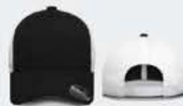
NEGRO/BLANCO UN TALLA