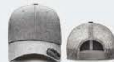
GRIS CL JASPE/GRIS CL S/M - 55CM - 64CM UNITALLA