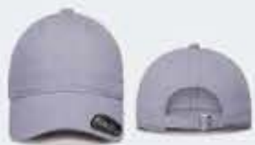
LAVANDA SKU: 19842-0700 UNITALLA