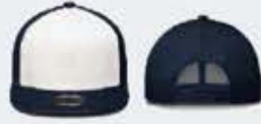
BLANCO/A.MARINO/A.MARINO SKU: 42194-00009 UNITALLA