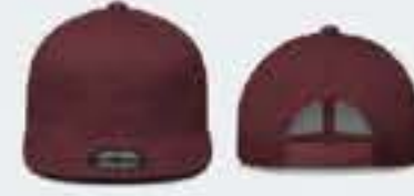
VINO SKU: 42194-00015 UNITALLA