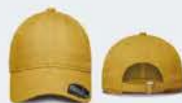
AMARILLO MOSTAZA SKU: 19842-0696 UNITALLA