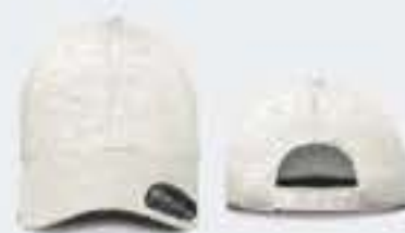
BLANCO NUBE SKU: 20192-02005 UNITALLA