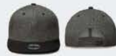
GRIS OBSC.JASPE/NEGRO SKU: 10794-04004 UNITALLA