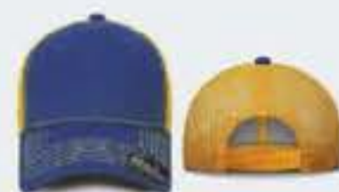
AZUL REY/A.MANGO SKU: 10492-01029 UNITALLA