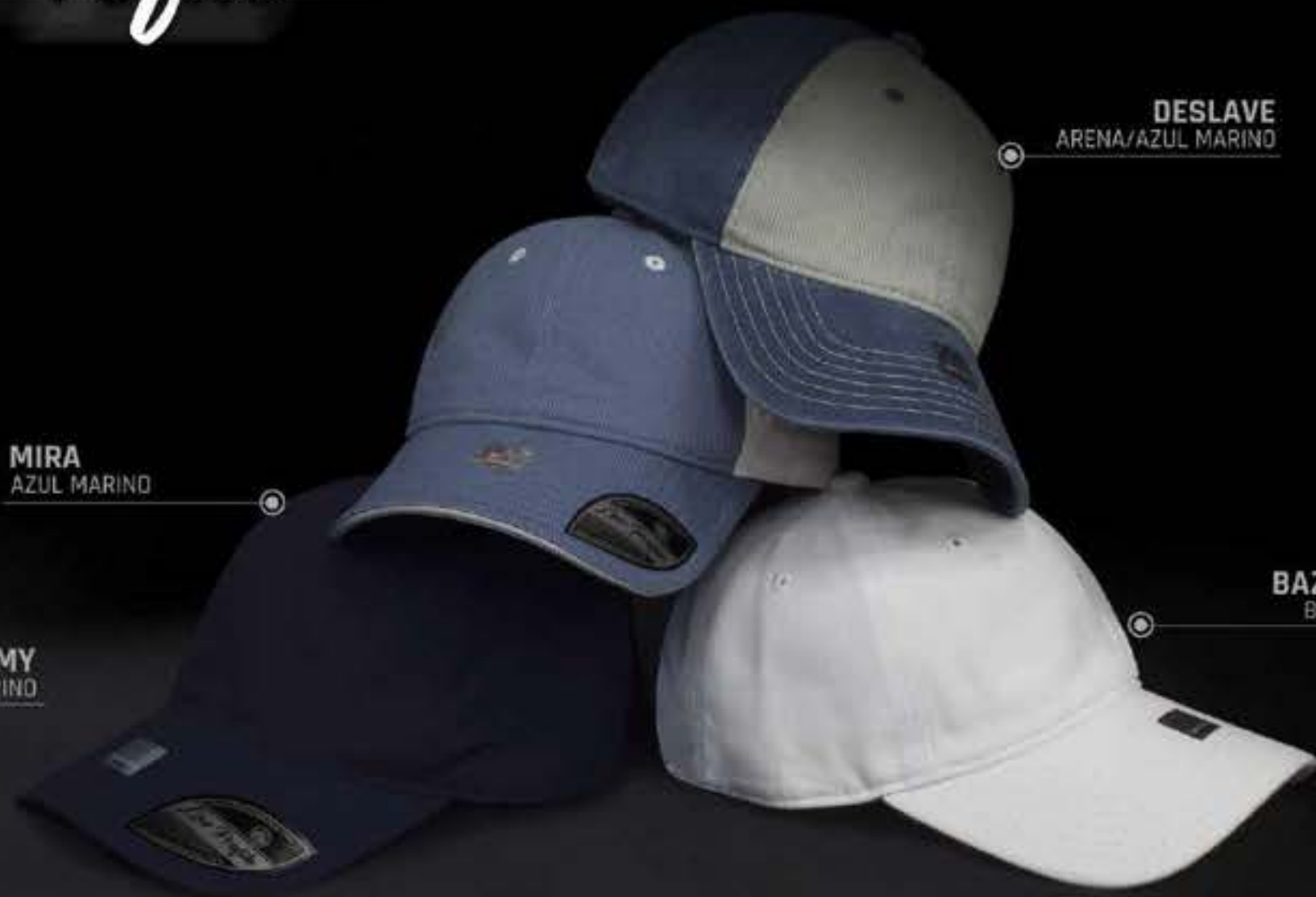
DESLAVE ARENA/AZUL MARINO