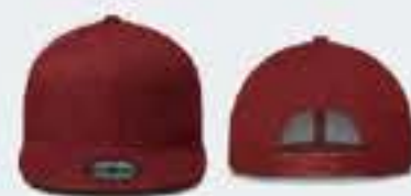
VINO SAL: 82794-02105 UNITALLA