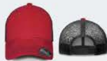
ROJO/NEGRO SKU: 22761-180045 UNITALLA