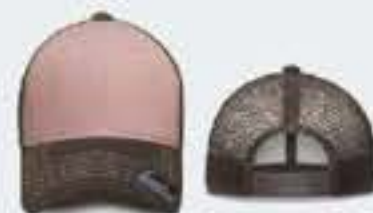
ROSA PASTEL/CAFÉ/CAFÉ SKU: 22761-180045 UNITALLA