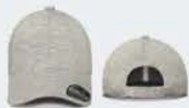
GRIS CLARO JASPE SKU: 20192-02004 UNITALLA