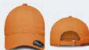
NARANJA CLARO SKU: 19842-0698 UNITALLA