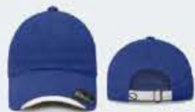
AZUL REY/BLANCO UNITALLA