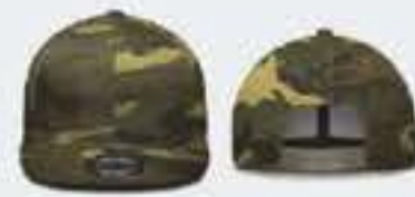
CAMUFLAJE VERDE MILITAR SKU: 42194-00020 UNITALLA