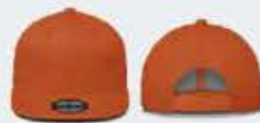
NARANJA MANDARINA SKU: 8274-00000 UNITALLA