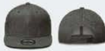
GRIS OBSCURO JASPE SKU: 10794-04402 UNITALLA