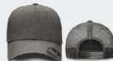
GRIS OBSC. JASPE/GRIS OBSC S/M - 55CM - 64CM UNITALLA