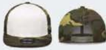
BLANCO/CAMU/CAMU SKU: 42194-00008 UNITALLA