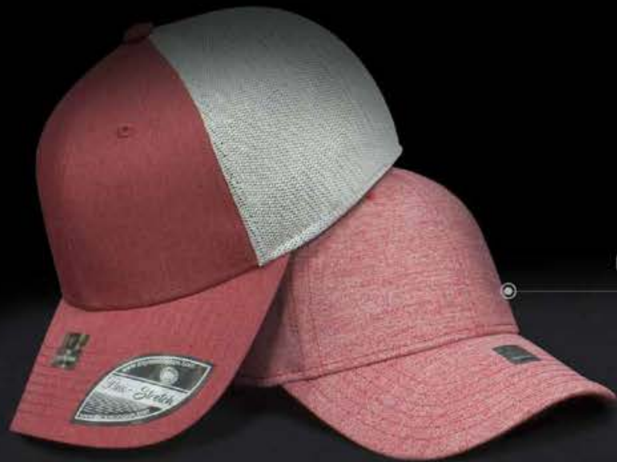
KAMIKAZE ROJO JASPE