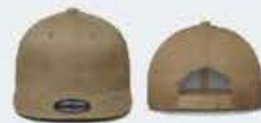
KAKY SKU: 8274-00000 UNITALLA