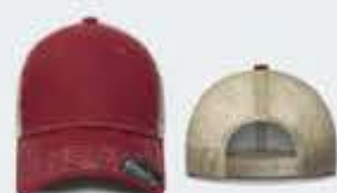
VINO/KAKY 040. 24901-24902 / UNITALLA