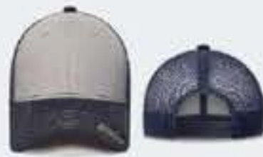
GRIS CLARO/A.MARINO/A.MARINO SKU: 10790-48002 UNITALLA