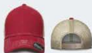
ROJO/KAKY 040. 24901-24902 / UNITALLA