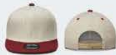
ARENA JASPE/VINO SAL: 82794-02105 UNITALLA