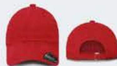
ROJO SKU: 19842-0690 UNITALLA