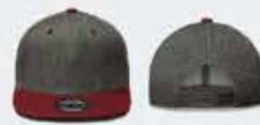
GRIS OBSC.JASPE/VINO SKU: 10794-04004 UNITALLA