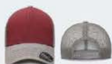
VINO/GRIS/GRIS 040. 24901-24902 / UNITALLA