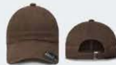
CAFÉ SKU: 19842-0693 UNITALLA