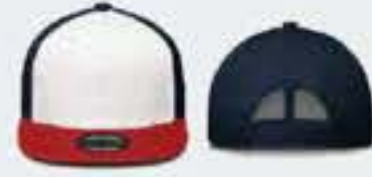
BLANCO/ROJO/A.MARINO SKU: 42194-00010 UNITALLA