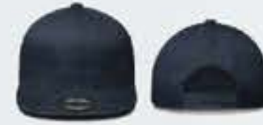
AZUL MARINO SKU: 42194-00023 UNITALLA