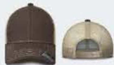
CAFÉ/KAKY 040. 24901-24902 / UNITALLA