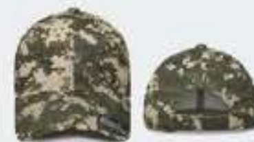
DIGI CAMU VERDE