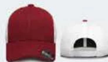
ROJO/BLANCO UN TALLA