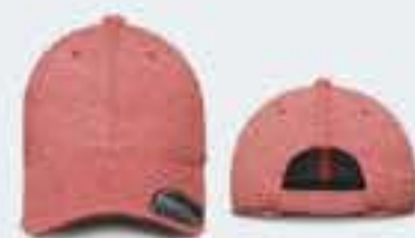
ROJO JASPE SKU: 20192-02010 UNITALLA