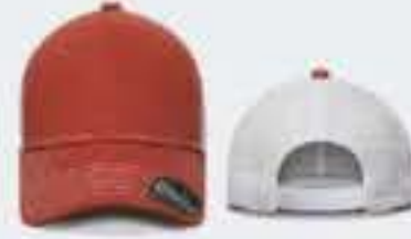
N.MANDARINA/BLANCO SKU: 22761-180045 UNITALLA