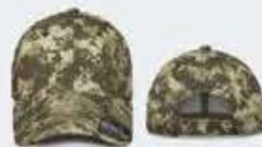
DIGI CAMU KAKY